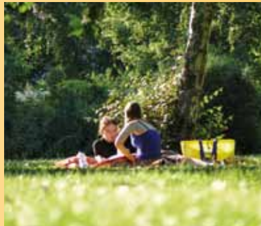
Creative Commons Attribution-Share Alike 2.0