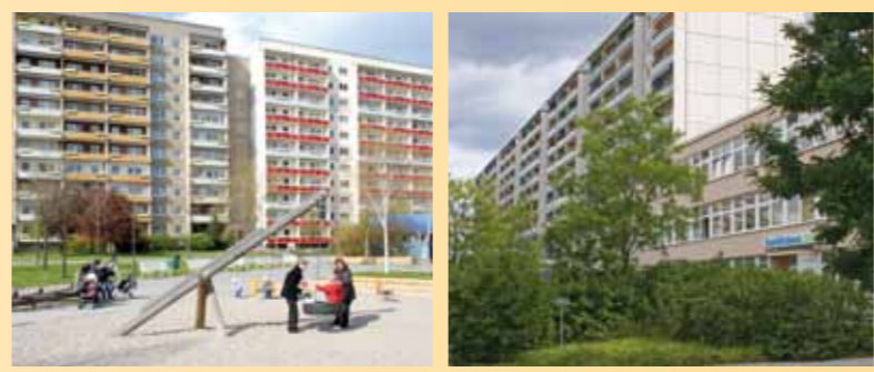
Wohnkomplex 4: Stuttgarter Allee 8–18, 19–21 Breisgaustraße 25–35, 37–51, 59–81 Offenburger Straße 5–15

Nur wenige Schritte trennen Sie vom Allee-Center. Aber auch entlang der Stuttgarter Allee befindet sich eine Vielzahl an weiteren Geschäften. Zudem findet hier zweimal wöchentlich ein Wochenmarkt statt.