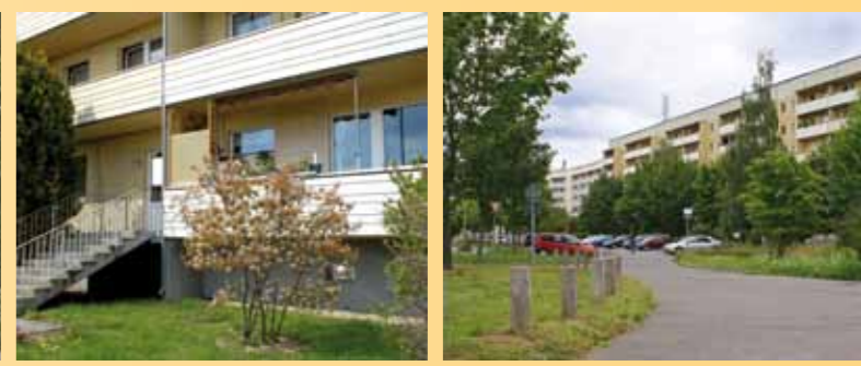
Wohnkomplex 7: Plovdiver Straße 56–74

Kindergärten, Schulen und eine Ärztehaus sind bequem zu Fuß zu erreichen. Auch bis zum Kulkwitzer See sind es nur wenige Gehminuten. Während die Wassersportanlage zum Wasserski, Segeln, Surfen und Tauchen einlädt, können Radfahrer und Skater den geteerten Weg um den See befahren.