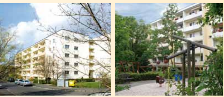
Wohnkomplex 2: Dahlienstraße 3–73

Durch die Nähe zu Plagwitz und Lindenau ist die Anbindung an das Stadtzentrum sehr gut. Die Straßenbahnhaltestelle ist in nur drei Gehminuten erreicht.