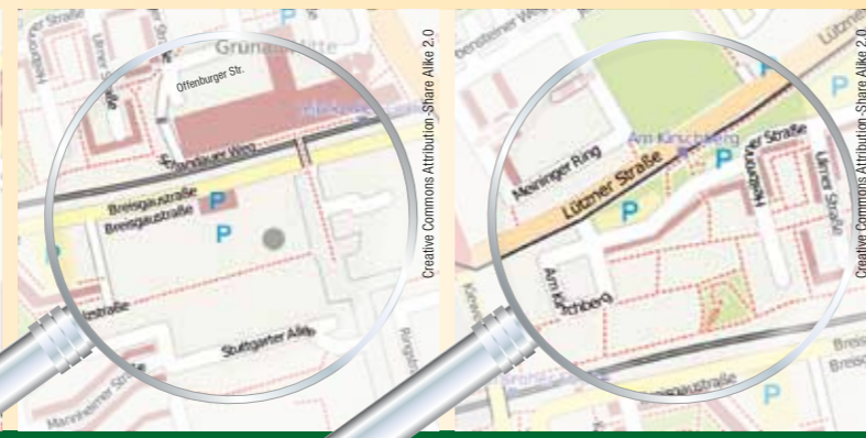
Wohnkomplex 5: Heilbronner Straße 2–8, 13–19, 7–11 Am Kirschberg 1–5, 7–13, 15–21, 23–29 Ulmer Straße 2–12