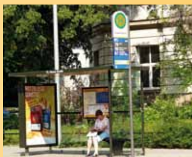
Creative Commons Attribution-Share Alike 2.0